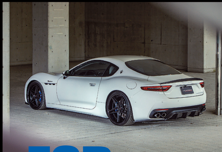
2022年に登場した2代目グラントゥーリスモ。マセラティ伝統の2+2クーペ(カブリオレ)だ。今作はICE(3.0 V6 ツインターボ)以外にBEV(フォルゴレ)を用意する。