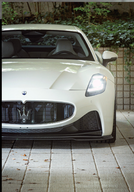
イタリアのハイブランドを中心にオリジナルエアロパーツを開発するリープデザインの最新作が2代目グラントゥーリスモだ。フロントスポイラー、サイドステップ、リヤアンダースポイラー、トランクスポイラーなどのメニューとなる。この開発車両のようにカーボンにすればぐっとスポーティに、FRPでボディ同色としてエレガントな雰囲気も強調させても良さそうだ。